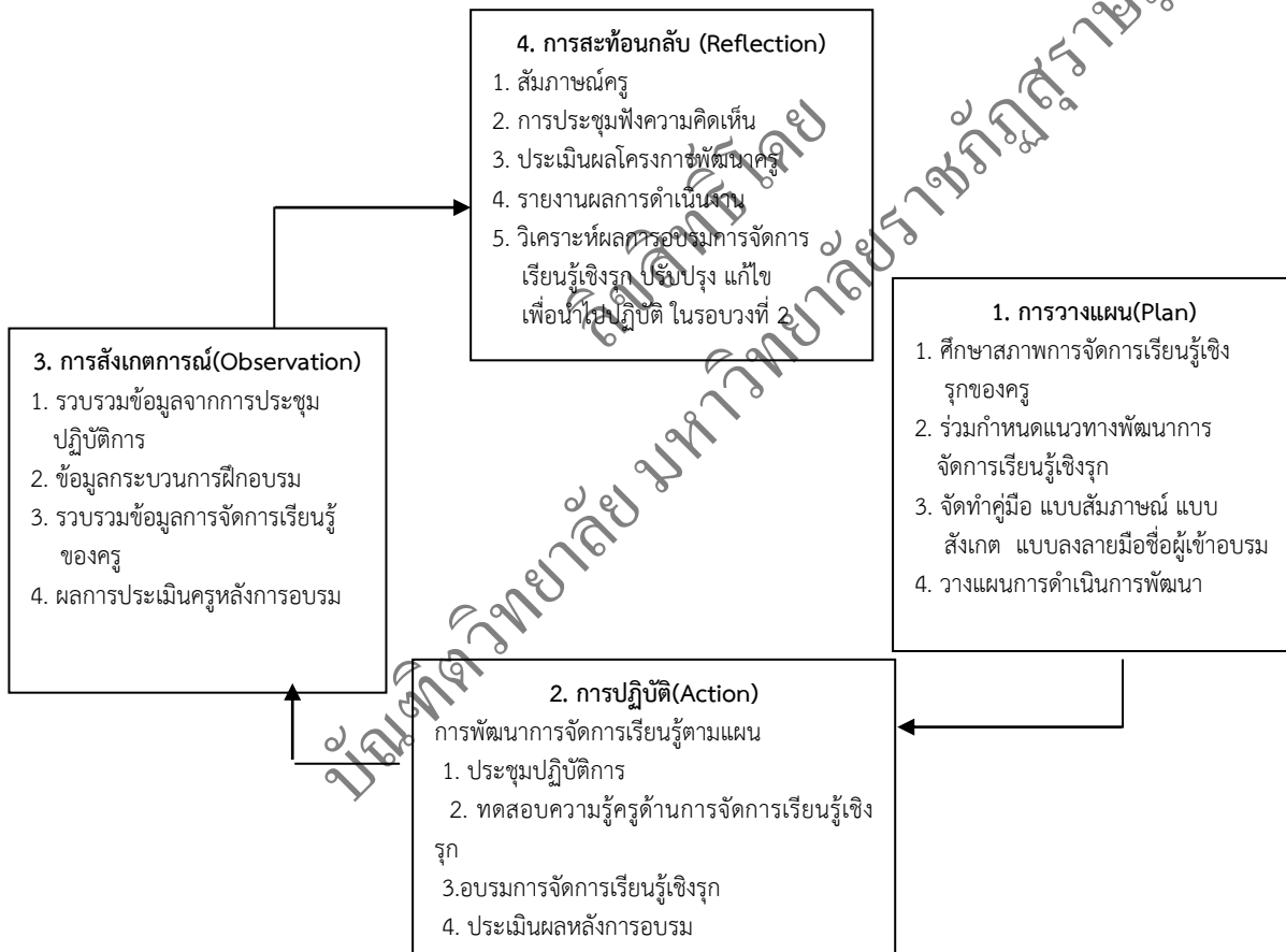
ภาพที่ 1 : ขั้นตอนการดำเนินการรอบที่ 1

การวิจัยเรื่องการพัฒนาการจัดการเรียนรู้เชิงรุกโดยใช้กระบวนการนิเทศสำหรับครูในโรงเรียนประถมศึกษา 4 สำนักงานเขตพื้นที่การศึกษาประถมศึกษาชุมพร เขต 1 โดยใช้กระบวนการวิจัยเชิงปฏิบัติการ (Action Research) ตามแนวคิดของ Kemmis และ McTaggart (1990) 4 ขั้นตอน ผู้วิจัยได้ดำเนินการตามขั้นตอน และนำเสนอตามลำดับดังนี้ 1. การวางแผน (Planning) 2. การปฏิบัติการ (Action) 3. การสังเกตการณ์ (Observation) 4. การสะท้อนผล (Reflection) โดยได้ทำการทำการปฏิบัติการด้วยขั้นตอนดังกล่าว 2 รอบ ซึ่งขั้นตอนการดำเนินการรอบที่ 1 และ 2 ดังนี้